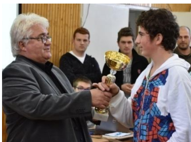
II. Közgáz Robot Szumó Bajnokság

A SZAKMATÚRA ELNEVEZÉSŰ rendezvényen, a Berettyóújfalui Szakképzési Centrum tizenhárom tagintézménye között mutatkozhatott be iskolánk a leendő középiskolások előtt, november 14-én. A szakképzést népszerűsítő pályaválasztási kiállításra a sportházban került sor. Iskolánk Arduino eszközökkel és turisztikai kvízzel jelent meg a standon.