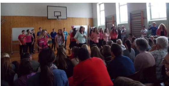
ELSŐ OLDAL UTOLSÓ OLDAL az elsősavatóról