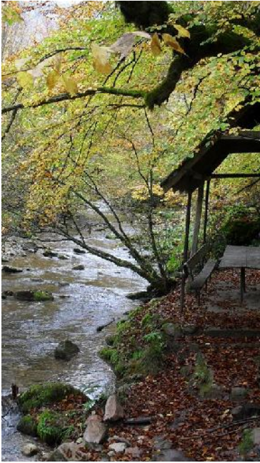
UTOLSÓ OLDAL