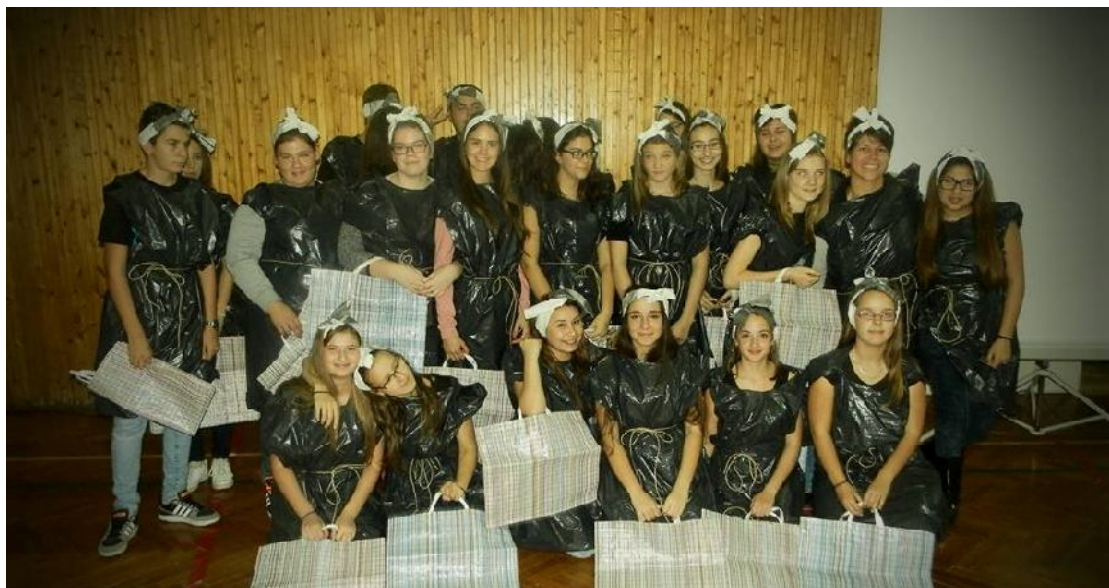
A 9.A osztály aznap – és a 9.B osztály másnap.