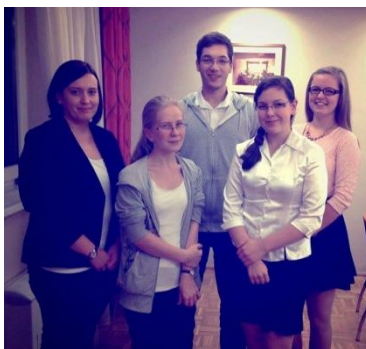
Csapatunk a PénzSztár vetélkedőn