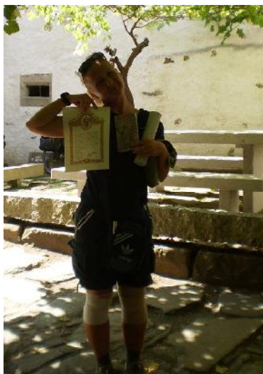
Santiago de Compostella, az El Camino túra teljesítéséről szóló oklevéllel

9. Mi a legszebb hely, ahol járt? Magyarországon rengeteg gyönyörű hely van. Szívem csücske a Mátra, de szeretem a Pilist; Sopron, Pécs, Gyula, Szeged, mint városok, és még sorolhatnám. Külföldre is többször eljutottam. Szerettem Írországot is; Törökország, Olaszország sokáig volt szerelem. Városok tekintetében Prága, Assisi, Sienna, de lehetne ezt is hosszan sorolni. Mostanában Spanyolországban jártam többször. Nagy élmény volt az olasz vulkántúra, és a spanyol El Camino. Oda jövőre is szeretnék menni.