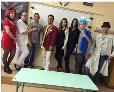
Halloweeni beöltözők (12.A)

RÖPLABDA BAJNOKSÁGOT rendezett a DÖK-napi verseny két házigazdája, a 11.A és a 11.B. A versenyt a 12.A osztály nyerte, a részletes eredmények az úság 13. oldalán olvashatók.