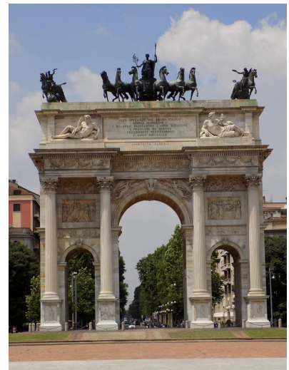
↑ Parco Sempione di Milano

If you wish to eat a pizza, forget it after 1.30 p.m. This is because of the famous Siesta. The