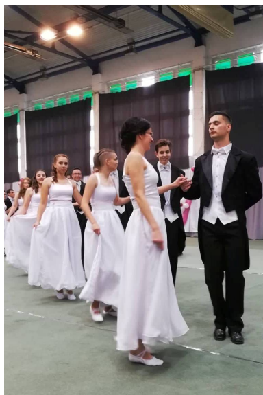
Végzőseink tánca a szalagavató ünnepségen