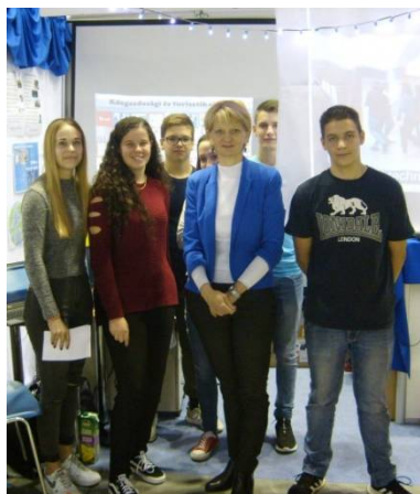
Pályaválasztási kiállítás a Főnix Csarnokban

MEGKAPTÁK A SZALAGJUKAT a végzős osztályok tanulói október 5-én, egy látványos iskolai ünnepség keretében. A negyvenkét tanuló idén is együtt adta elő tánctát a szülők és tanárok előtt.