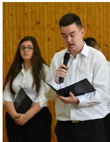
Október 23-ai ünnepségünk

NYÍLT NAPOT TART A SULI november 14-én. Szeretettel várunk minden érdeklődőt a 10 órától kezdődő programokra!